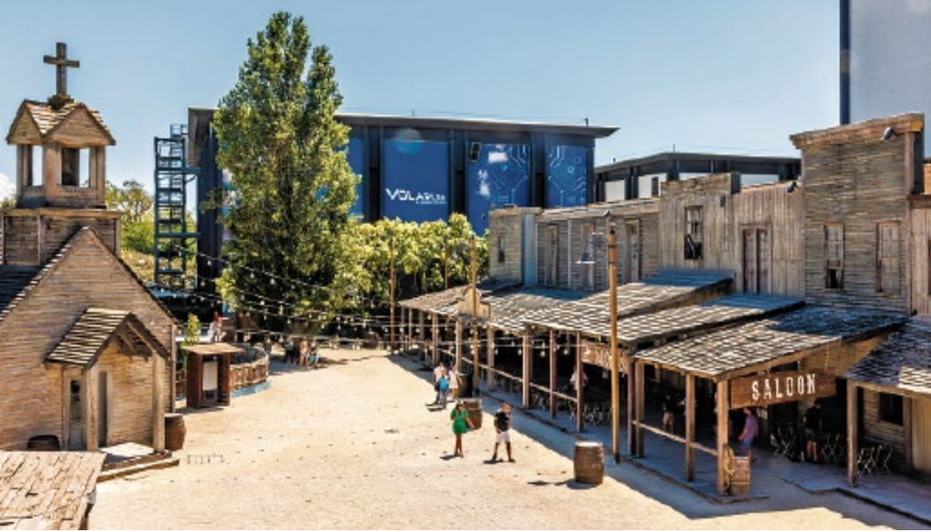
Ohne rauchende Colts: Western-Setting mit dem Restaurant Saloon, wo man die berühmten Pfannen-Bohnen erhält.